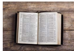
Hauskreis - Info's